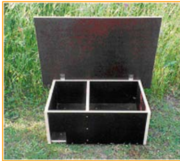
«Modell» 1: Kombiniertes Igel-Schlaf- und Futterhaus