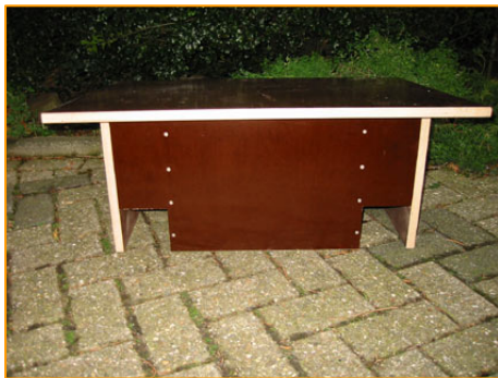
«Modell» 2: Igel-Futterhaus mit zwei katzen-geschützten Eingängen